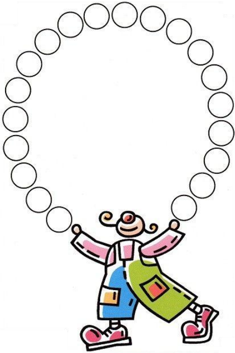
Le jongleur et ses balles

Les métiers du cirque : Découvre les métiers du cirque en coloriant les images