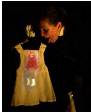
Chaperons Rouges, Art Zygote

Théâtre d'objet : Théâtre où l'on se sert d'objets qui peuvent être plus ou moins transformés ou assemblés pour faire des personnages.