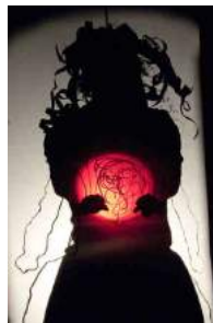
Y es-tu, La Compagnie s'appelle Reviens

Le théâtre d'ombre : Marionnettes qui se manipulent derrière un écran illuminé par une source lumineuse. Les ombres peuvent être articulées ou non. Elles peuvent être soit manipulées à l'aide de fines tiges verticales ou horizontales combinées ou non à des fils, soit, tenues à la main contre l'écran. Les ombres peuvent être opaques, et donner un effet de silhouette, ou translucides et colorées. Les matériaux utilisés sont le cuir, le carton ou le plastique. C'est certainement la plus ancienne forme de marionnette.