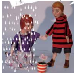
La reine des neiges, Compagnie La Cavalière Bleue

Aujourd'hui, la marionnette à gaine étant associée à Guignol, les compagnies ont tendance à se tourner vers d'autres types de marionnettes, peut-être pour vaincre le cliché.