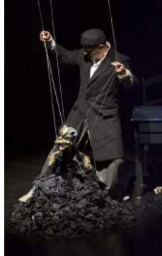
Salto Lamento, Figuren theater Tübingen

Marionnette à fils : Marionnettes dont la manipulation se fait par le haut à l'aide de fils suspendus à ses membres. Ce type de marionnette est aussi appelé « Fantoche » et nécessite beaucoup d'habileté pour la manipuler. Une variante de ce type de marionnette est la « liégeoise » qui mélange les fils (toujours aux membres) et une tringle métallique fixée à la tête.