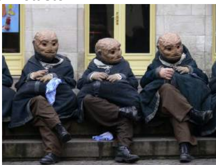
Padox, Compagnie Houdart-Heuclin

La marionnette portée : Le manipulateur se place à l'intérieur du corps de la marionnette. Elle est fixée sur la tête ou le dos du marionnettiste.