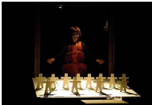
C'est pas pareil ! Compagnie Clandestine

Avec, ils reconstruisaient les représentations et pouvaient rejouer les pièces en miniatures. Aujourd'hui, le théâtre de papier est protéiforme, il peut être présenté sous forme de papier mâché, de pop-up, d'origami – kirigami, etc.