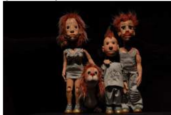
2084, un futur plein d'avenir, Flash Marionnettes

Marionnette à prise directe : Le manipulateur prend directement le corps de la marionnette pour la faire bouger. Par exemple, il prendra la jambe pour la faire marcher, sans l'intermédiaire d'une tige.