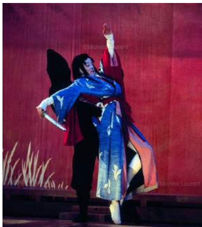
Le théâtre du Soleil, Tambours sur la digue

Le bunraku, marionnette japonaise est une marionnette à contrôle qui fait environ 1 mètre de haut et qui nécessite au moins trois manipulateurs : un pour la tête et le bras droit, un pour le gauche, et un pour les pieds et les attitudes. Les voix sont faites par un homme qui se situe sur le côté de la scène et un shamisen (instrument à cordes japonais) accompagne les spectacles qui sont souvent de durées longues.